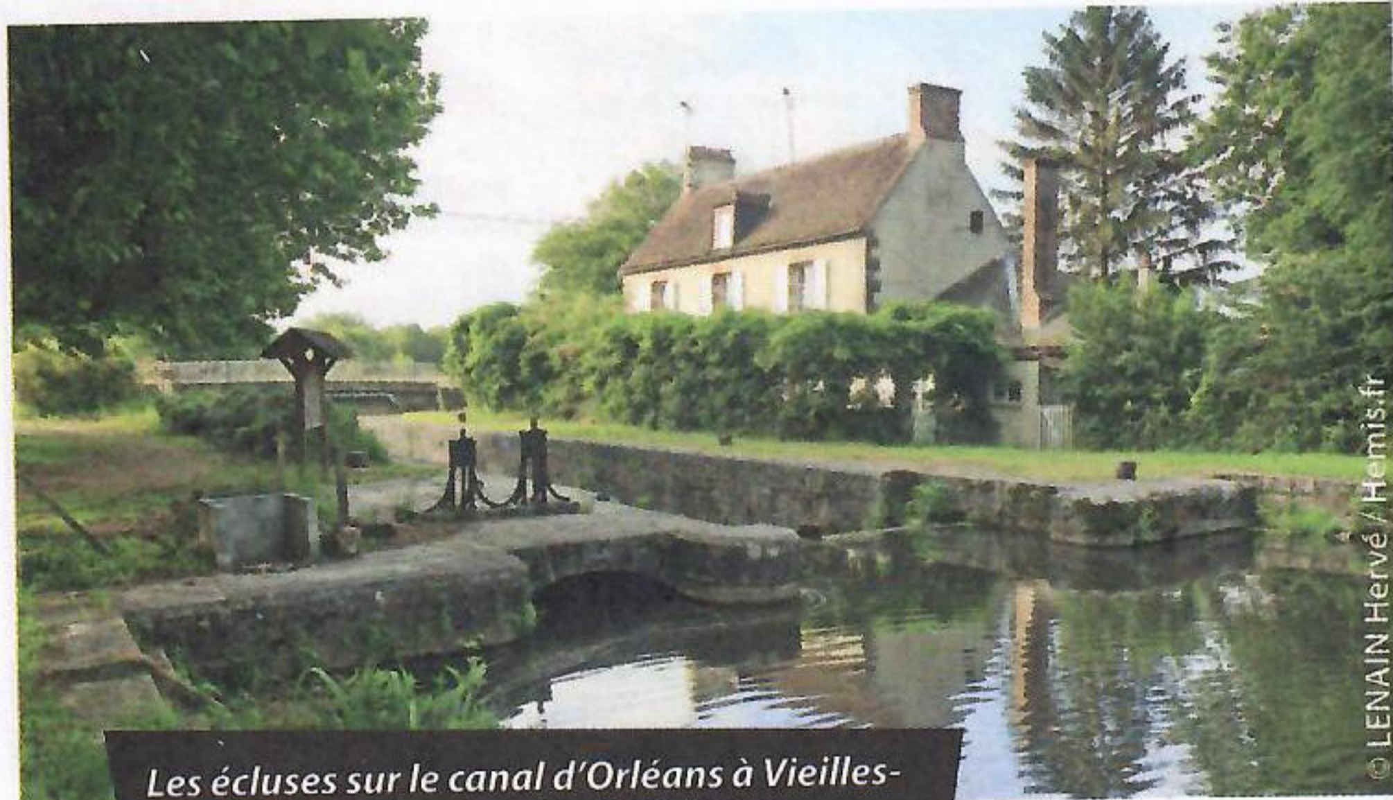
Les écluses sur le canal d'Orléans à Vieilles-Maisons-sur-Joudry, site de Grignon

Bon à savoir : accueilli par des bénévoles, vous pourrez voguer à bord de la Belle de Grignon, copie d'une flûte du XIX e s.