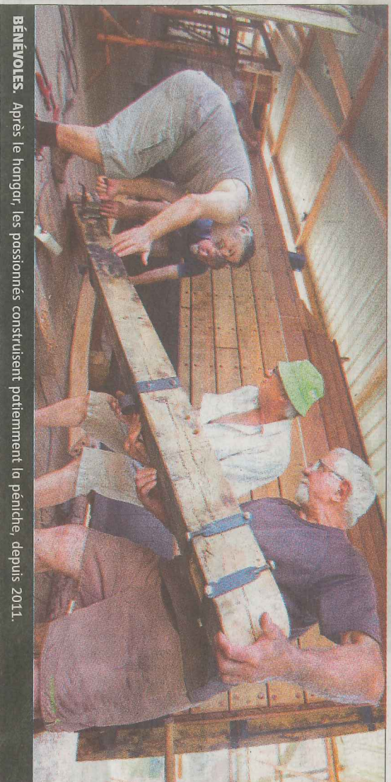
BÉNÉVOLES. Après le hongur, les passionnés construisent patiemment la péniche, depuis 2011.

➔ Pratique. Informations et réservations à l'Office de tourisme de Lorris ou 02.38.94.81.42, ou par courriel : ot.lorris@comcomtgr.fr Plus d'infos sur le chantier : www.belledegrignon.fr